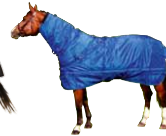
Winterdecke mit Halsteil 330 g 393 € Art nr 2113 125cm-165cm Blau