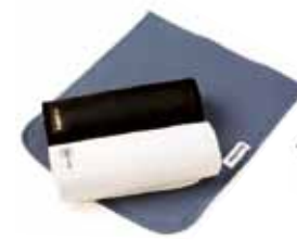
Arbeitsunterlagen 36,50 € Art nr 2010 30x40 cm - 40x50 cm Blau, Schwarz & Weiß