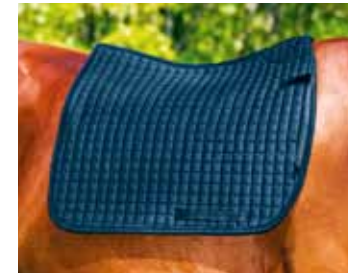
Schabracke 78,75 € Art nr 2130/2131 Dressur/Springform Schwarz & Weiß