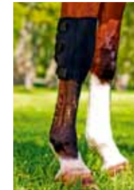
Karpalgelenkschoner 43 € Art nr 2035 S, M, L & XL Schwarz