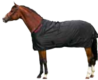
Sommerdecke 293 € Art nr 2123 115cm-165cm Schwarz