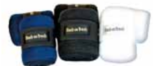
Fleecedbandagen 70 € pro Paar Art nr 2040 Blau, Schwarz & Weiß