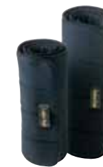
No Bow-Unterlagen 77 € pro Paar Art nr 2050 31x45 cm - 41x51 cm Schwarz