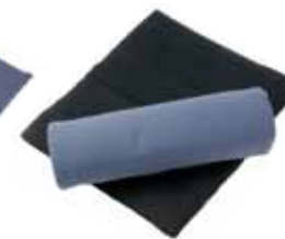
Dicke Unterlagen 40 € Art nr 2011 50x55 cm - 50x68 cm Schwarz & Blau-grau