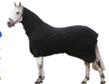
Fleecedecke mit Halsteil - € Art nr 2117 115cm-165cm Schwarz