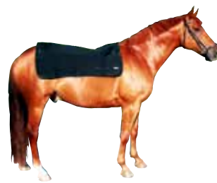
Rückenwärmer ab 86 € Art nr 2100 100x100 cm / 100x120 cm Schwarz