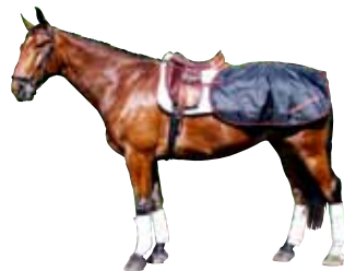
Nierendecke 103 € Art nr 2126 135cm-155cm Schwarz