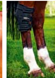
Sprungelgelenkschoner mit oder ohne Ausschnitt 48 € Art nr 2015 S, M & L Schwarz