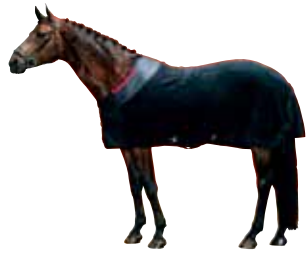
Fleecedecke mit oder ohne Halsteil ab 232 € Art nr 2116 115cm-165cm Schwarz & Blau