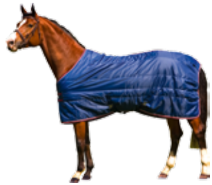
Stalldecke Rime 160 g 321 € Art nr 2119 115cm-165cm Schwarz & Blau