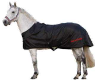
Stalldecke 110 g 321 € Art nr 2115 115cm-165cm Schwarz