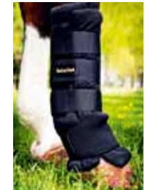
Stallgamaschen 96,80 € pro Paar Art nr 2030 35x40 cm - 45x40 cm Schwarz