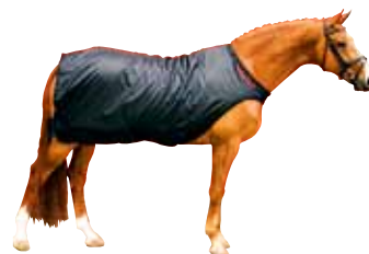
Führdecke 293 € Art nr 2128 145cm / 155cm Schwarz