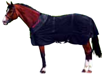
Netzdecke 243 € Art nr 2118 115cm-165cm Schwarz