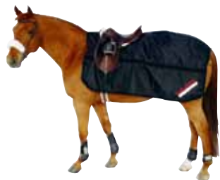
Schrittdecke 186 € Art nr 2125 125cm-165cm Schwarz