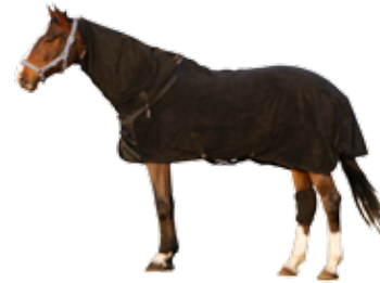
Halsteil Fleecedecke 279 € Art nr 2216 135cm-165cm Schwarz